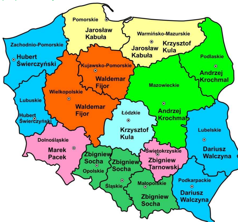
Rysunek 1. Mapa podziału województw na członków KInO

Członkowie KInO współpracują z komisjami regionalnymi i podejmują działania aktywizujące poszczególne środowiska.