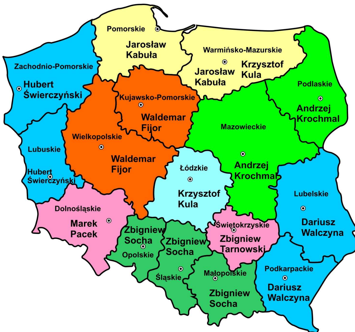
Rysunek 1. Mapka podziału województw na członków KInO